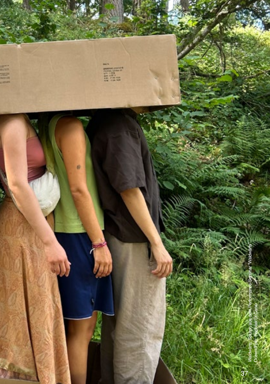
Waldwärts: Spuren aus dem Performance-Seminar "Waldwärts" Dozent/Foto: Raphael DiCamillo