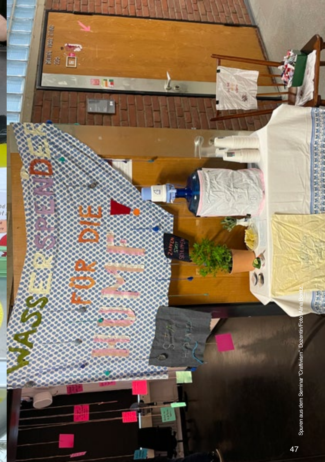
Spuren aus dem Seminar "Creativism": Dozentin/Foto Alina Bontz.