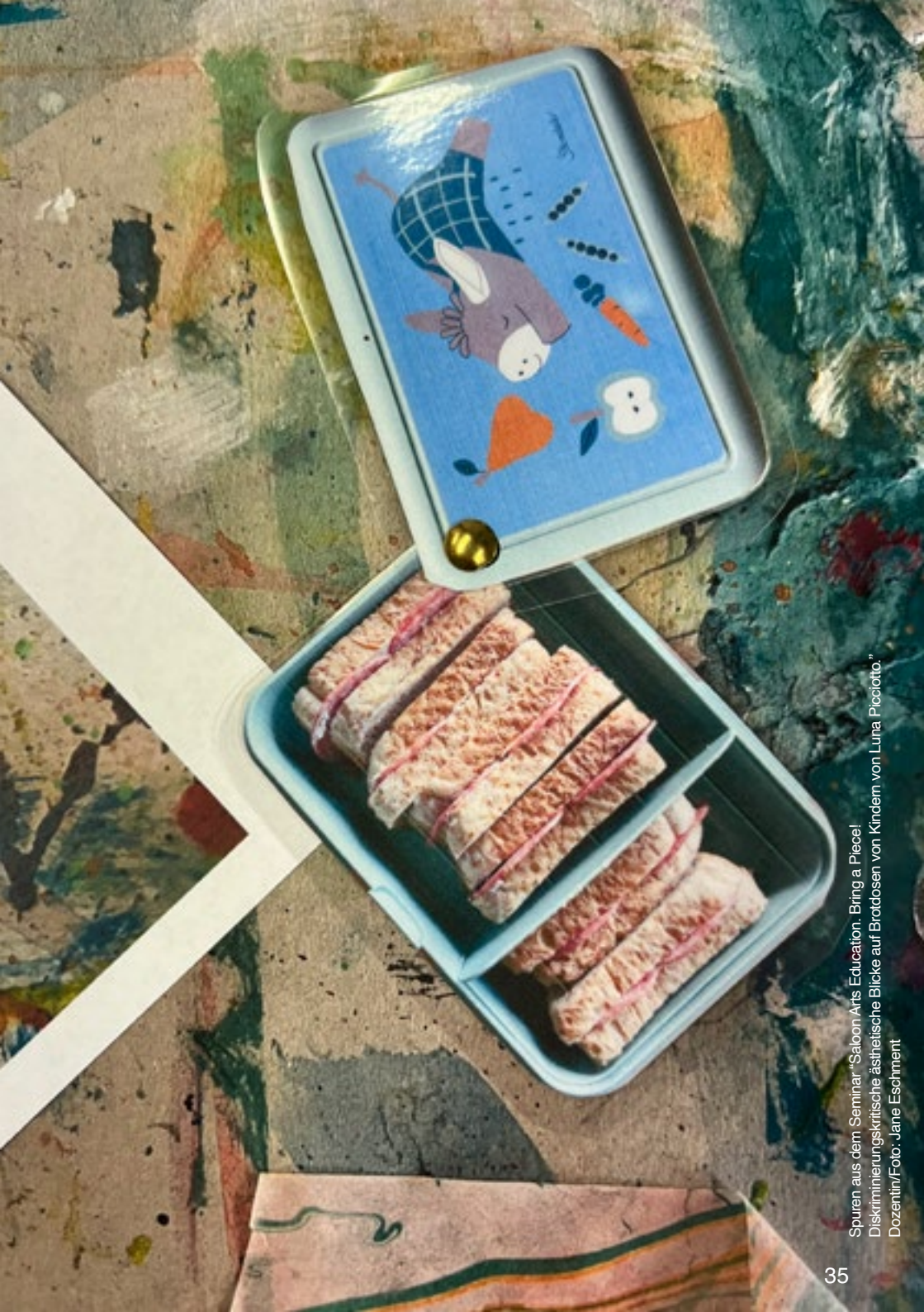
Spuren aus dem Seminar "Saloon Arts Education. Bring a Piece Diskriminierungskritische ästhetische Blicke auf Brotdosen von Luma Picciotto." Dozentin/Foto: Jane Eschment