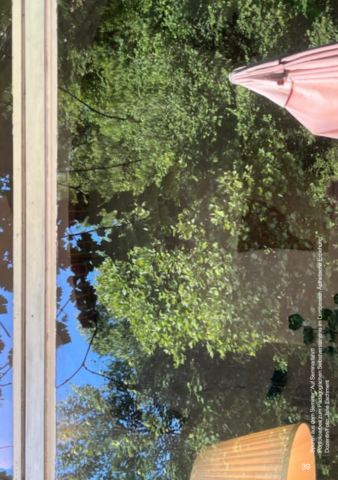
Spuren aus dem Seminar „Auf Seminarfahrt! Portfoliarbeit zum Pädagogischen Selbstverständnis im Lernbereich Ästhetische Erziehung“ Dozentin/Foto: „Jane Eschmeit